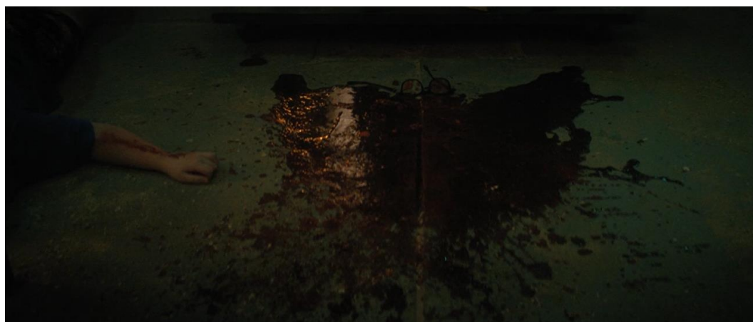
Figura 3: Uma criança é morta pelo serial killer : ao contrário de outras mortes, que são mais gráficas, essa é a imagem mais explícita de seu assassinato; ao vitimizar uma criança, a obra tira qualquer componente moralizante acerca das vítimas do slasher .

Já em Fear Street: 1978 essas máximas quanto às vítimas não são reproduzidas. Ou, ao menos, não em sua totalidade: Joan, uma alegre moradora de Shadyside, é visceralmente morta após acender um baseado pós-sexo. No entanto, sua morte mais parece uma referência aos filmes antigos, sendo, inclusive, a única cena de (breve) nudez de toda a trilogia. Seu assassinato, contudo, é apenas mais um: crianças, retratadas sem nenhum pingão de malícia, também são violentamente mortas (Figura 3). E por mais que o filme reserve a possibilidade de ser explícito apenas com o assassinato de personagens mais velhos, recordo que a morte de crianças é algo extremamente raro nos slashers . Em Fear Street: 1978 , Leigh Janiak demonstra que não existe um motivo nessas mortes, sendo elas completamente aleatórias e, dessa forma, destituindo qualquer possibilidade de se inferir culpa à vítima. Em outras palavras, um usuário de maconha tem tanta chance de ser morto quanto uma criança que só quer fazer novas amizades. A morte deixa de estar atrelada à uma condição da vítima, e passa a ser vinculada somente ao assassino.