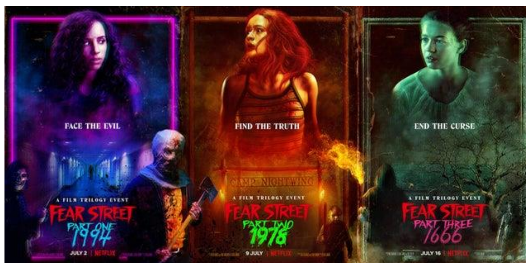
Figura 1 – Os pôsteres dos três filmes se complementam, demonstrando a unidade narrativa da trama; no entanto, a paleta de cores demonstra a diferença de estilo dos três períodos e dos três subgêneros retratados.