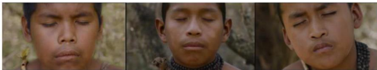
Imagem 3 - Os olhos fechados. Fonte: Eami. Dir. Paz Encina. Paraguai, França, Alemanha, Argentina, México, Estados Unidos e Países Baixos. 2022

Os primeiros planos de crianças com os olhos fechados acompanhados por narrações do abandono da floresta, de sua casa, da dor da fragmentação de suas famílias e do mundo até então conhecido são apresentados durante o filme. A atmosfera fílmica nos transporta da narração coletiva às lembranças íntimas e as múltiplas perspectivas individuais sobre o trauma da separação da comunidade com a floresta. A polifonia do evento traumático desemboca na separação do espaço de recordação afetiva (espaço familiar que evoca a felicidade) e do espaço significante (vital e identitário).