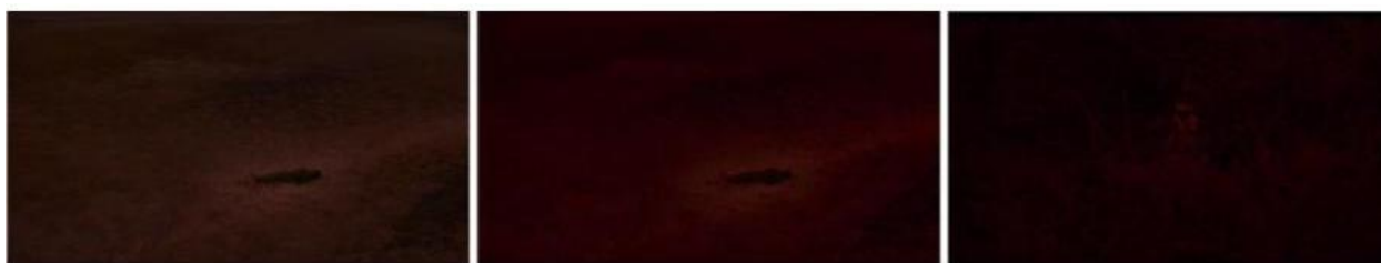
Imagem 4- O luto por Acojai. Fonte: Eami. Dir. Paz Encina. Paraguai, França, Alemanha, Argentina, México, Estados Unidos e Países Baixos. 2022