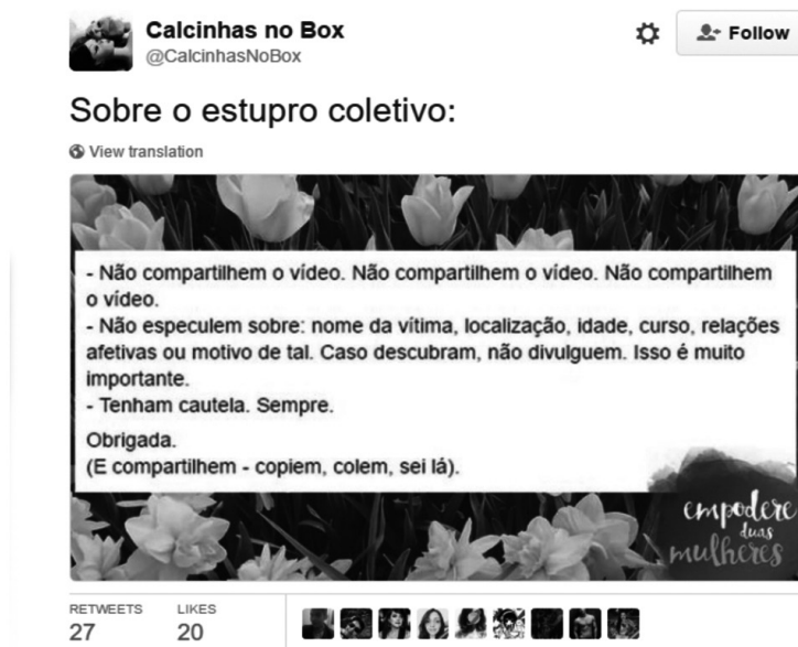
Figura 2 – Exemplo de Post Conscientização/Solidariedade