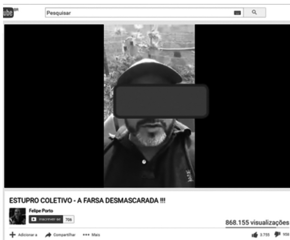
Figura 4 – Vídeo 2