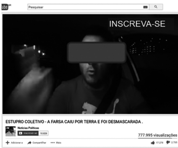
Figura 3 – Vídeo 1

Ainda assim, há críticas contundentes à conduta da adolescente, à cobertura da mídia, ao papel da sociedade, à atitude dos pais na educação dos filhos, como as que são apresentadas nos dois vídeos analisados a seguir, selecionados em razão de até o fim da coleta dos dados da pesquisa já contarem com 777 mil e 868 mil visualizações, respectivamente, números representativos em termos de audiência. Ambos foram postados por homens.