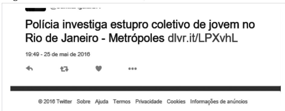
Figura 1 – Post com link de notícia, em 25 de maio de 2016

A seguir, alguns exemplos do comportamento dos atores sociais nas postagens: