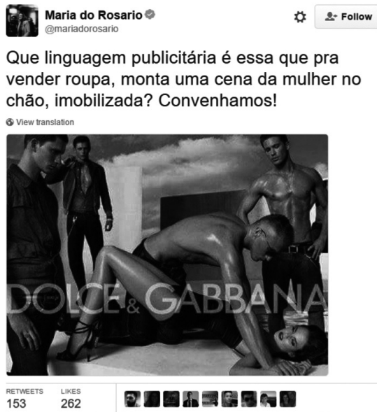
Figura 5 – Publicidade estimula estupro coletivo