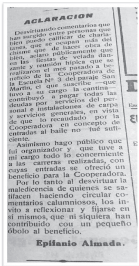
Imagen 3 – Aclaración en el periódico El Imparcial