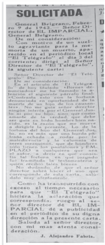
Imagen 2 – Solicitada en el periódico El Imparcial

Las temáticas comunes tenían que ver con desmentir solicitadas anteriores, tal como lo recién visto, o de otros medios. Eran muy comunes las contestaciones a publicaciones en el periódico El Telégrafo , la competencia local, en las solicitadas, tales como la que aparece en el ejemplo a continuación: