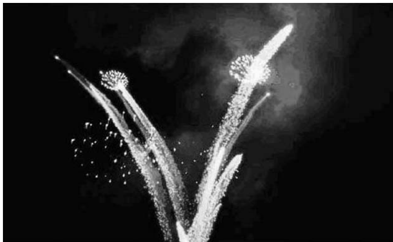
Figura 2: Frame do filme 1

são de tempo, pois indica a duração de cada evento, como se vê na figura 1.