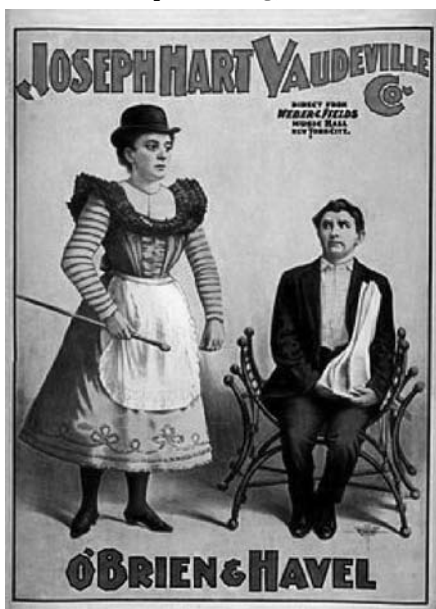
Figura 3: Cartaz de Vaudeville, 1899

décadas após, nos famosos musicais hollywoodianos .