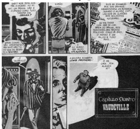
Figura 4: metade de página da GN

Deveras importante é a associação constante ao teatro de Vaudeville , que sempre se fazia acompanhar de música, tendo dado origem ao espetáculo de variedades com presença de números musicais, o que explicaria o papel da música na GN e o entendimento das ações do herói vingador, principalmente porque ele toca piano em momentos cruciais para o desenvolvimento