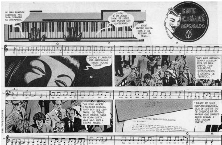
Figura 6: Página horizontal da GN

Nas páginas seguintes, a alusão à música fica ostensiva e bastante original, em se tratando de uma GN, principalmente entre as páginas 30 e 41, que são constituídas como uma sequência ilustrada musicalmente. Como um longo travelling horizontal, passa-se de uma página a outra, com o mesmo esquema cromático e a mesma diagramação, em que as vinhetas são alternadas com linhas de partituras musicais. Esta é a única parte da GN que tem diagramação uniforme e na horizontal: são vinhetas estreitas, em duplas e delimitadas pelas linhas da partitura musical. Com Eisner, diríamos que o timing é conservado durante toda a seqüência. O efeito é extraordinário para uma narrativa gráfica, como se observa