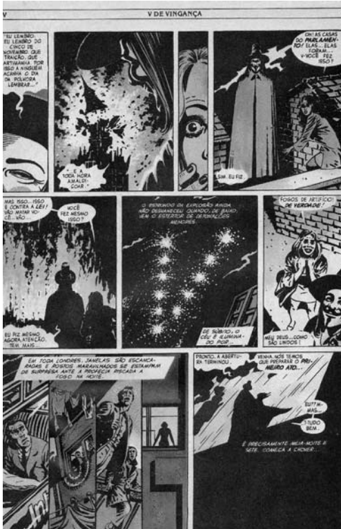
Figura 1: Página da GN

A disposição, a forma e o tamanho de cada vinheta revelam-se elementos estruturantes essenciais da ação, o que permite a percepção do timing de que fala Will Eisner (1999, p.26).