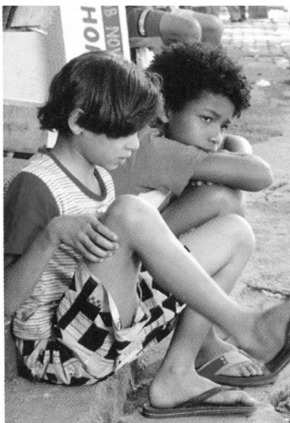
Ilustração 2 – Os protagonistas de Arroz com feijão

Os dois enredos têm em comum o esforço dos meninos da favela para obter dinheiro. Sua ação é impulsionada pela situação de carência. O episódio de 1962, assim como Um favelado , assume um discurso de denúncia do desamparo a que os personagens estão submetidos. Ao lado da visão realista que capta esse drama, há momentos poéticos e de humor. Já na produção de 2010, o tom é humorístico na quase totalidade do enredo, embora os actantes