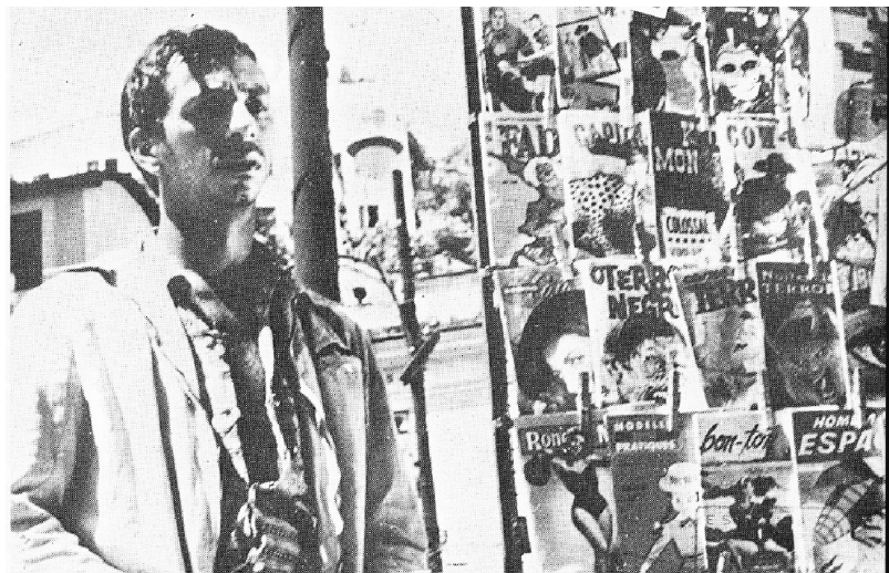
Ilustração 1 – Em Um favelado , a miséria leva ao roubo

os gastos com os estudos. Ele passou, então, a levar cocaína obtida com os traficantes do morro para vender para os colegas de curso. Essa atividade, que o angustia por obrigá-lo a transgredir a lei, quase custou a vida de seu irmãozinho, que ingeriu a droga. A punição surge como consequência do risco de morte da criança e também parte da reação do médico que atendeu o menino e do policial aposentado amigo da família.