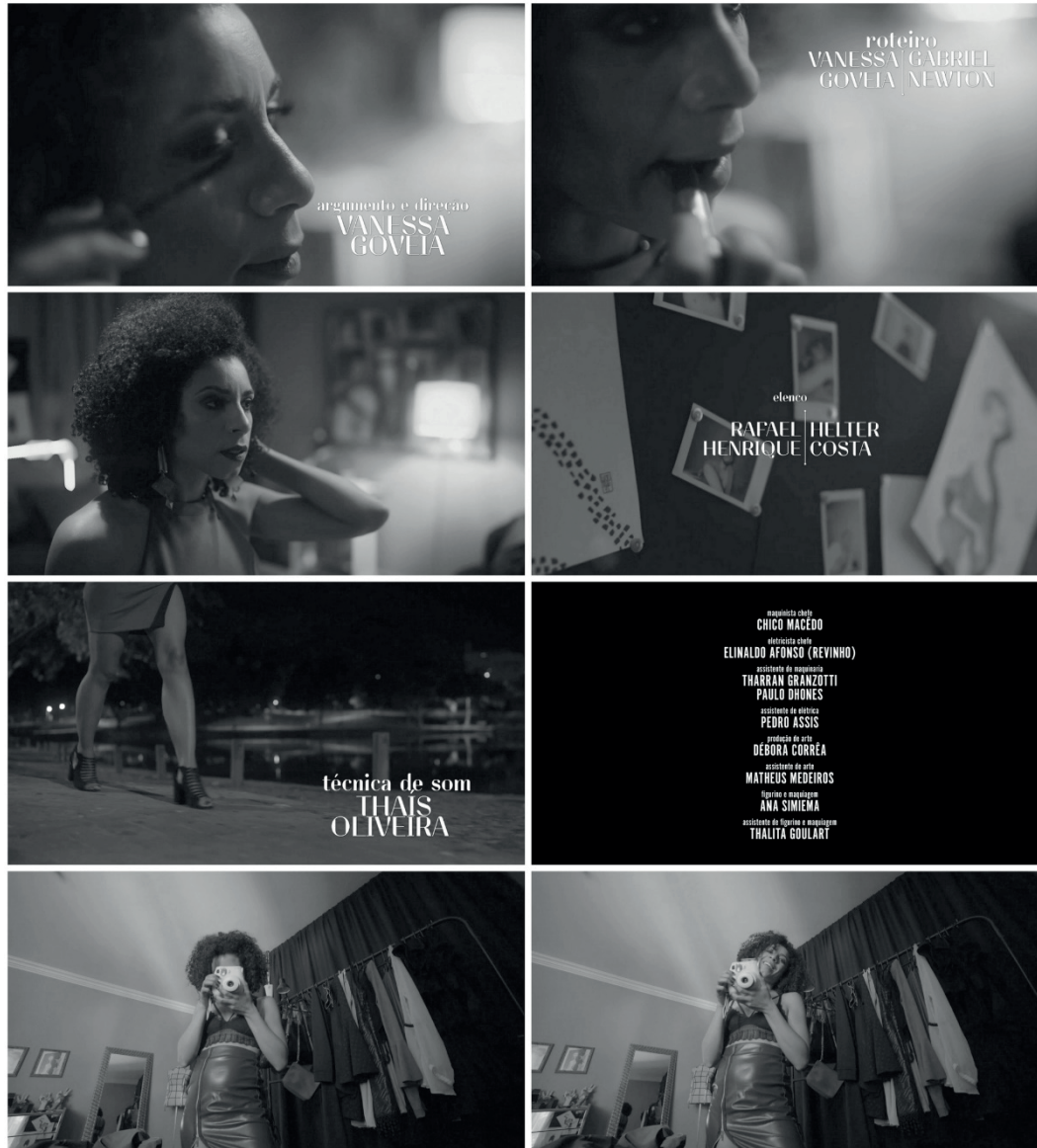
Figura 10 – A saga de Olívia continua

Fonte: Filme Viúva Negra (Vanessa Gouveia, 2017).