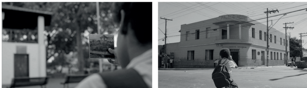
Figura 2 – A fotografia, o passado e o presente