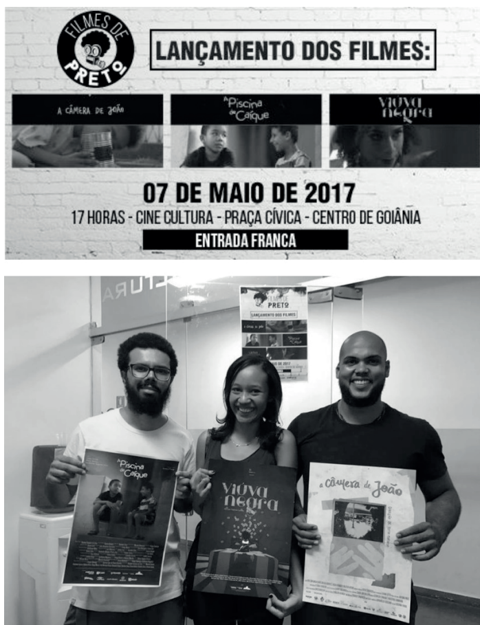
Figura 1 – Material de Divulgação online da mostra e foto dos realizadores com cartazes dos filmes

Fonte: Evento FILMES de PRETO e Página do filme Viúva Negra do Facebook (Foto: Ricardo Alvez) 2 .