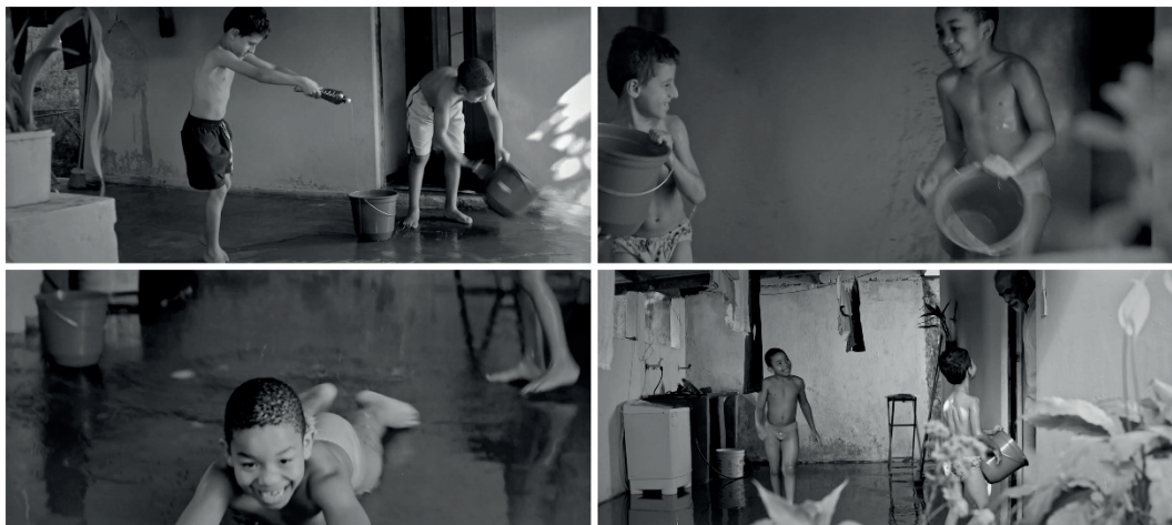
Figura 5 – Brincadeira de escorregar