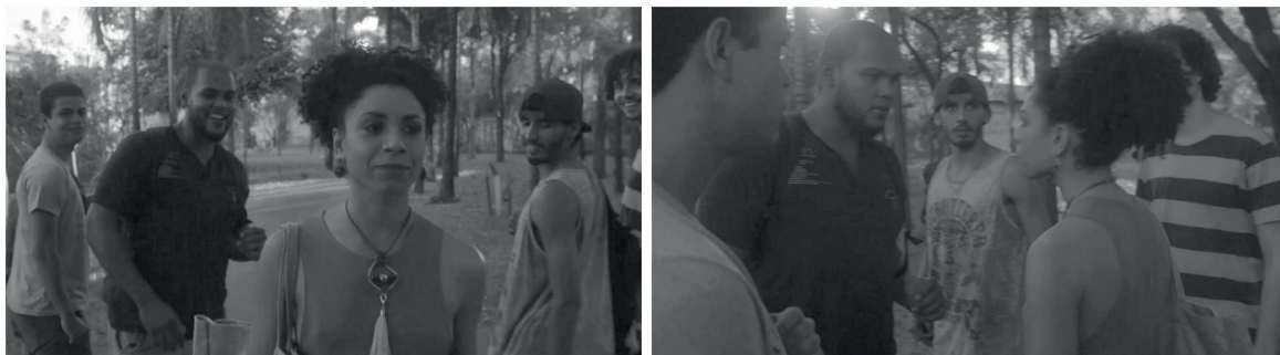
Figura 8 – A postura audaciosa de Olívia