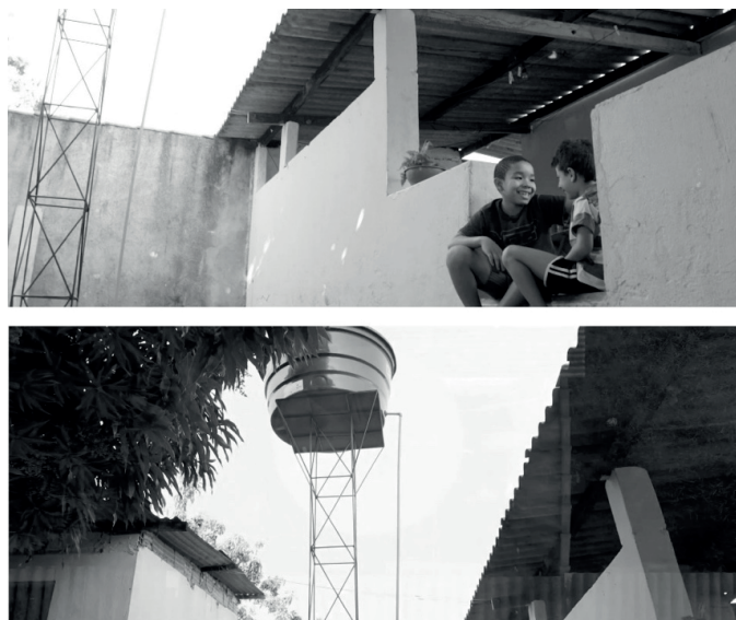
Figura 7 – A piscina de Caíque